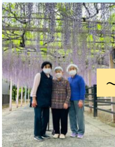
～～ 外出訓練・行事 ～～