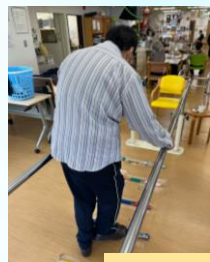
～～ 運動・レク・リハビリ風景