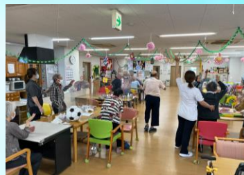
～～ 集団起立訓練やその他体操 ～～