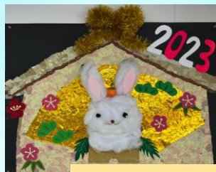
～～ 季節ごとの作品作り ～～