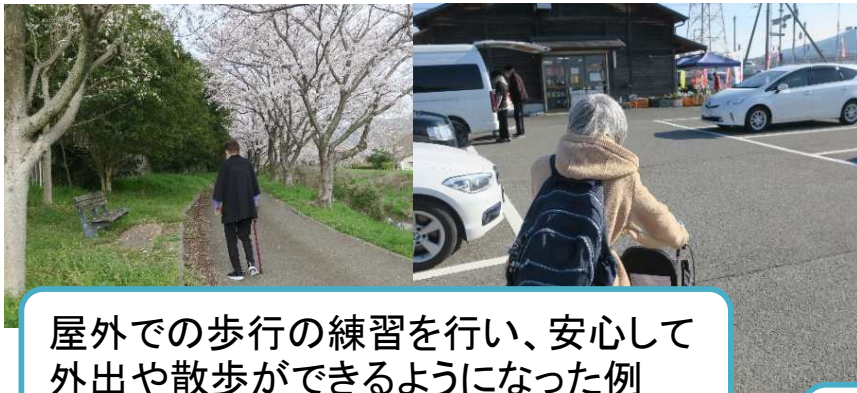
屋外での歩行の練習を行い、安心して 外出や散歩ができるようになった例